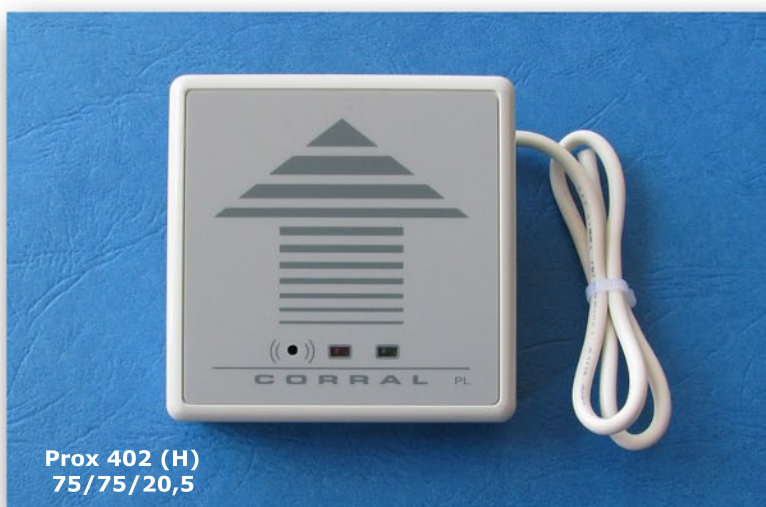
Prox 402 (H) 75/75/20,5