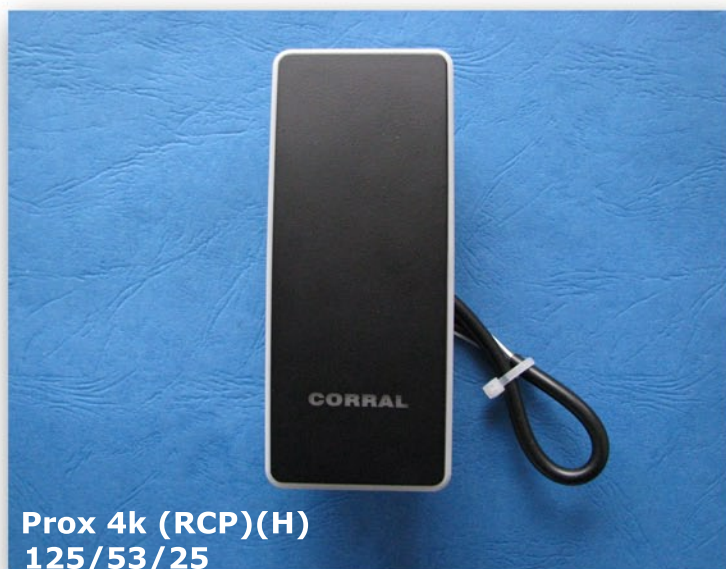
Prox 4k (RCP)(H) 125/53/25

Subtelne podświetlenie krawędzi obudowy w kolorze czerwonym, po zbliżeniu identyfikatora, zmiana koloru na zielony