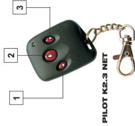
PILOT K2.3 NET

Programowanie odbywa się poprzez ustawienie suwaków microswitcha, umieszczonego na płycie kontrolera Radio Net, według poniższej tabeli: