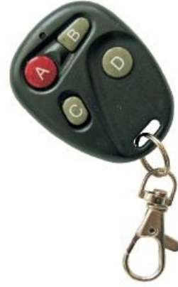
PILOT NET 4